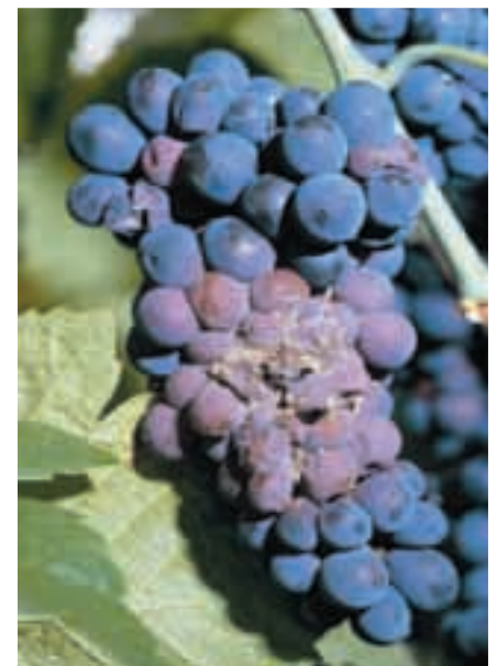
Bilder v.l.n.r.: Triebbasisbefall mit Schwarzflecken, roter Brenner und Botrytis beim Spätburgunder