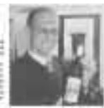
Qualitätswein Besten im Bereich

Woditschka / Qualitätswein Der Vollmond-Wein hat sich bei der Weinverkostung in der Kategorie 'Qualitätswein' durchsetzen und den ersten Platz belegt. Die Jury hat den Vollmond-Wein als 'Besten im Bereich' ausgezeichnet. Die Jury hat den Vollmond-Wein als 'Besten im Bereich' ausgezeichnet. Die Jury hat den Vollmond-Wein als 'Besten im Bereich' ausgezeichnet.