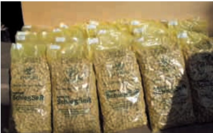
Bild: Erwähnenswert ist in diesem Zusammenhang sicher auch, dass seit der Behandlung der Korke die Anzahl der verkorkten Flaschen stark abgenommen hat und die Prozentzahlen „gekipppter“ Weine weit unter den Sätzen derjenigen Winzerkollegen liegen, die ihre Korke aus derselben Lieferung wie die Woditschkas erhalten haben.

Die Produktion, die vor der Anwendung der instrumentellen Biokommunikation im Jahre 1998 noch unter 10.000 Flaschen pro Jahr betragen hatte, konnte in der Folge zu Lasten der Herstellung von Sektgrundwein in drei Jahren um 150% auf zuletzt über 25.000 Flaschen gesteigert werden.