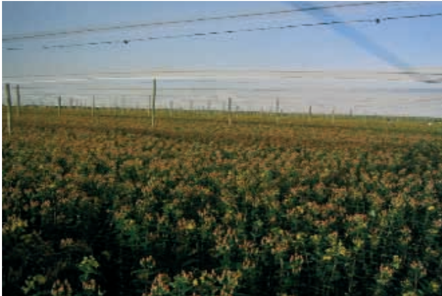
Abb. 5: Kräftige Hypericum-Pflanzen der Sorte „Pinky Flair“

stimmungsort, für das Auspacken dort, die Auktion, bis hin zur Blumenvase beim Endverbraucher. Für jeden dieser einzelnen Schritte haben wir perfekte Bedingungen und eine perfekte Umgebung für perfekte Pflanzen programmiert, sowie eine lange Lebensdauer zur Zufriedenheit aller.