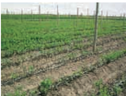
Abb. 3: Befallene Zone mit gesunden Pflanzen im Hintergrund

„Im Jahre 2003 wurden auf der Farm zwanzig Hektar mit zwei Sorten von Hypericum bepflanzt – Pinky Flair und Sugar Flair. Zu Beginn des Jahres 2004 verloren wir durch den Befall mit Wurzelknoten-Nematoden ( meloidogyne spp) ein Drittel unserer Hypericum-Produktion. Diese Aalwürmer schädigen die Pflanzen über das Wurzelsystem (siehe Abb. 2). Die daraus resultierenden Wunden machen die Pflanzen anfällig für sekundäre Infektionen, die die Pflanze dann im schlimmsten Fall ganz abtöten